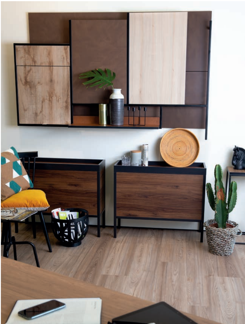
Das Dekor „Catania Eiche“, hier in Form zweier moderner Schränke in Szene gesetzt, begeisterte bereits auf der Sicam 2017. In angesagter Farbstellung wurde es erneut 2018 gezeigt.

Schattdecor präsentiert neue Dekor-Dimensionen für das tägliche Wohnen.